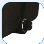
Τύπες αποστράγγισης για εύκολη χειμερινή συντήρηση Drain plugs for an easy wintering