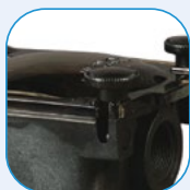
Διάφανο καπάκι See-through strainer cover