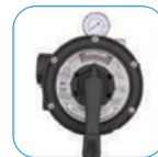
Πολλαπλή βαλβίδα Vari-Flo™ Vari-Flo™ 6-position valve