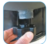
Αποστράγγιση με τάπα Drain with plug